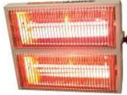
2MD30 (3000W) 2MD40 (4000W)