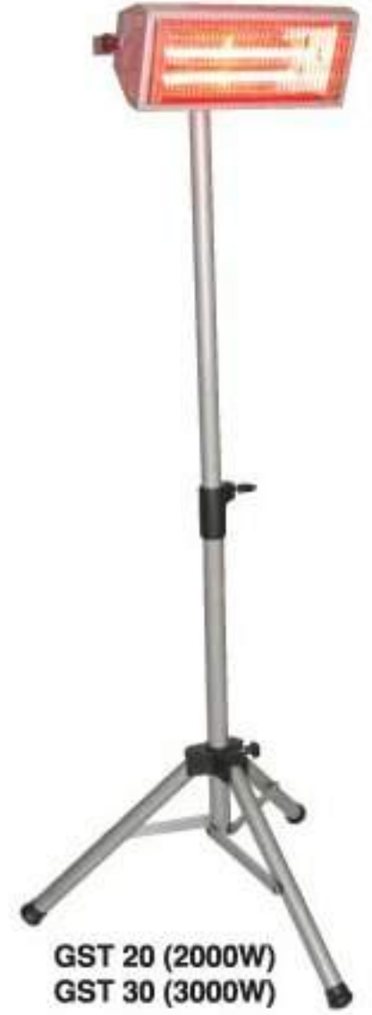
GST 20 (2000W) GST 30 (3000W)