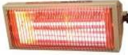
1M15 (1500W) 1M20 (2000W)