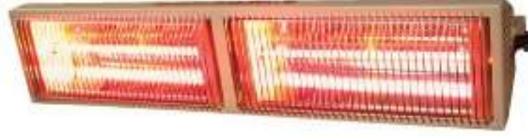
2MY30 (3000W) 2MY40 (4000W)